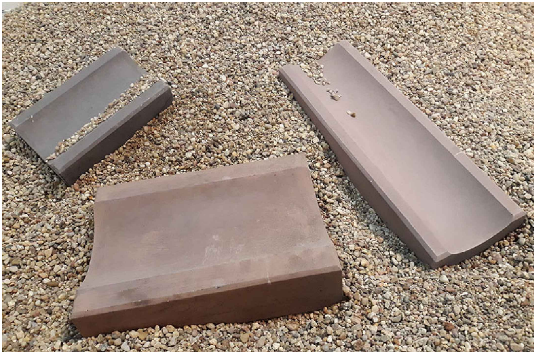
BETONOWE KORYTKA ODWADNIAJĄCE